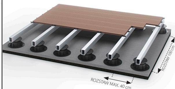
PRZĘKRÓJ POPRZECZNY SYSTEMU